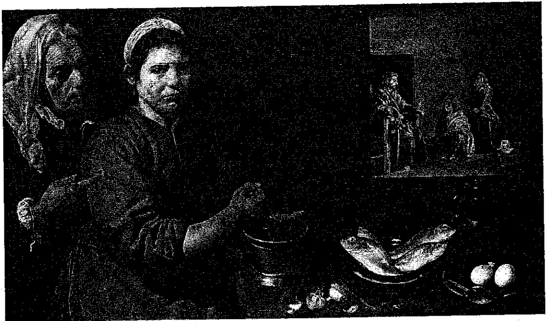
Diego Velázquez, Christ in the House of Martha and Mary , 1618, Oil on canvas, National Gallery, London